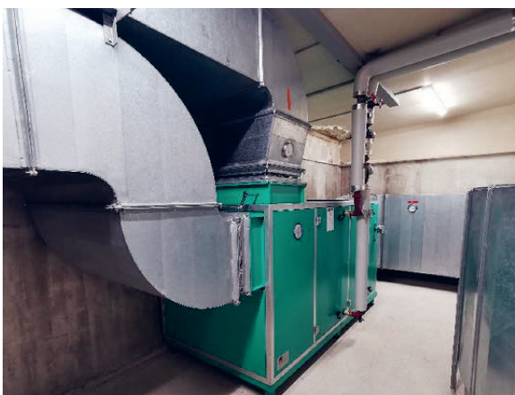
Monobloc einer Turnhalle, ohne Wärmerückgewinnung

Die Heizungs- und Lüftungsanlage (inkl. Mess-, Steuerungs-, Regel- und Leittechnik) als Wärmeverteilung der Sportanlage Schmittengässli wurde 1988 in Betrieb genommen. Die Anlage war immer funktionsfähig und sehr unterhaltarm. Seit einigen Monaten ist die Wärmeverteilung teilweise defekt. Mit grossem Aufwand könnte sie zwar instandgesetzt werden, würde jedoch den Energievorschriften nicht genügen. Zwei von drei Lüftungsmonoblöcken der Sporthalle, sowie zwei von vier Lüftungsmonoblöcken der Garderoben können nur noch manuell geregelt werden. Gemäss dem damaligen technischen Stand verfügen die Monoblöcke der Turnhallen über keine Wärmerückgewinnung. Die Luftqualität ist zeitweise schlecht.