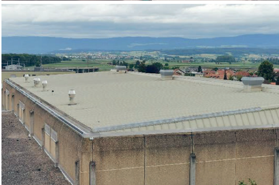
Dach Sportanlage mit verschiedenen Ablufthütten

Durch die nachhaltige Gesamtanierung wird die Anlage gemäss den Energievorschriften auf den aktuellen Stand der Technik gebracht und die Luftqualität deutlich verbessert. Insbesondere mit einer Wärmerückgewinnung aller Monoblöcke wird erheblich Energie gespart. Weiter können wieder alle Heizungs- und Lüftungsanlageteile über eine zentrale Steuerung reguliert werden, was den Energieverbrauch zusätzlich reduziert.